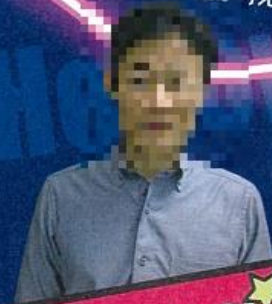
育徳館高等学校 第一学年主任

出会いとは偶然の産物であり、特に1年生にとっては育徳館での出会いにも随分と慣れてきたのではないのでしょうか。人は人生の様々なステージで、その時その場所に集った人と生活をしていくものです。勉強や部活動で切磋琢磨する友達もいれば、遊びや趣味でつながる友達もいることでしょう。この友達をとにかく大切にしてください。繋がりが続けてください。学生だからこそ、君たちには多くの時間が与えられています。今に感謝。