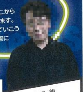
育徳館中学校 第一学年主任

中学1年生は、40校近い小学校から入学してきました。環境が大きく変わり、戸惑うことも多いかと思います。しかし、この変化は自分のテリトリーを広げ、社会生活の場を拡大していくことに他なりません。人間関係でつまずいたり、壁にぶつかったりという経験を経て、そこから友達との距離の測り方などを学んでいきます。失敗を恐れずに自分の可能性を広げていこうとする気持ちが、新しい生活に臨む際に大切なのだと思います。