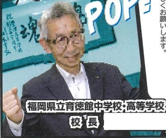
福岡県立育徳館中学校・高等学校 校長

保護者の皆様には、日頃から本校の教育活動に御理解と御協力、ありがとうございます。コロナも三年目になり、学校生活においても、マスク着用が当たり前になるなど、新しい生活様式が通常の生活様式になりつつあります。生徒達には、早くコロナ以前の学校生活に戻ってほしいものです。 さて、学校生活ですが、コロナは終息していませんが、今年度はコロナと共存しながら、教育活動を展開していきます。六月に実施しました体育大会で、三年ぶりに中学校・高校合同での一日開催をすることができました。また、二期、三期に予定しています文化祭やマラソン大会、修学旅行についても、実施予定です。 高P連主催の九州大会（長崎県）は、オンラインでの開催となりましたが、校内でのPTA活動につきましても、コロナと共存しながら感染対策をしつつ、保護者の皆様と協力して実施できたらと考えております。御協力をお願いします。 最後に、生徒達が、「育徳館に入学してよかった」と言えるような学校にしていきたいので、御支援をよろしく願います。